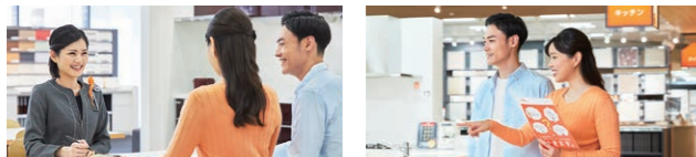
コーディネーターと一緒に見学